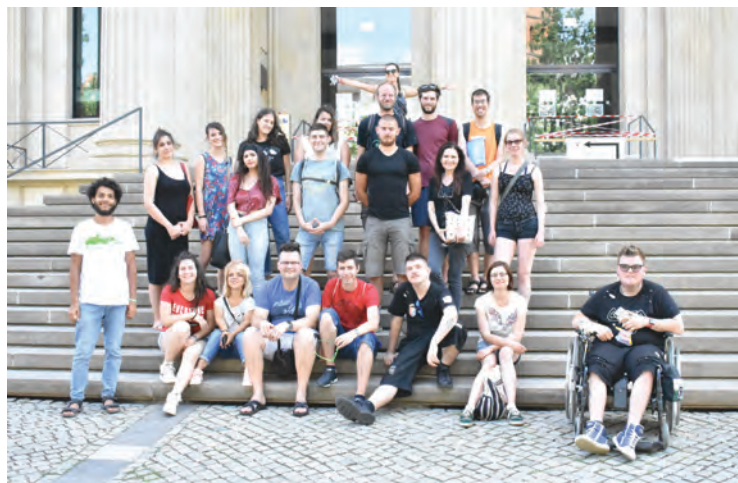
МЛАДИ КРАГУЈЕВЧАНИ ИСПРЕД ЗГРАДЕ ПАРЛАМЕНТА У ХАНОВЕРУ