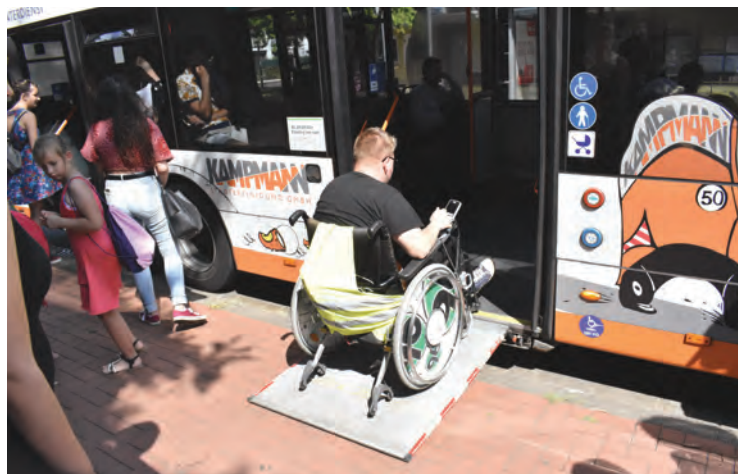
КЕЛВИН КОЛИЦИМА ЛАКО УЛАЗИ У СВАКИ ГРАДСКИ ПРЕВОЗ

Прво заустављање било је на тргу Кропке, једном од симбола