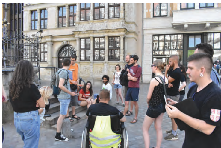
ПАУЗА ОД ШЕТЊЕ У ДРЕВНОМ ДЕЛУ ГРАДА